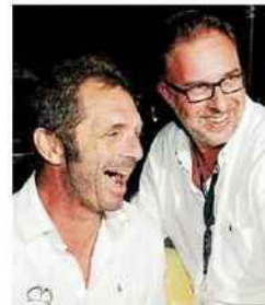
Le skipper trinitain et le patron mayennais continuent l'aventure ensemble.

Bien sûr. Avec le Groupe Actual, nous progressons ensemble