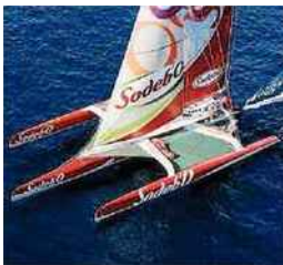
L'ancien Sodebo1 de Thomas Coville sera paré dans les prochaines semaines des couleurs du Groupe Actual.